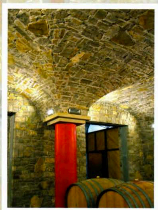
Pietrame Tranciato Scelto fugato con beole grosse