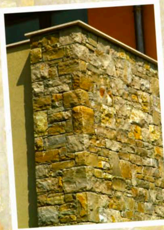
Secco - Semisecco