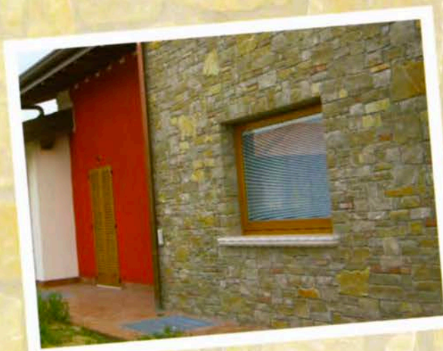
Fugato con mattoni