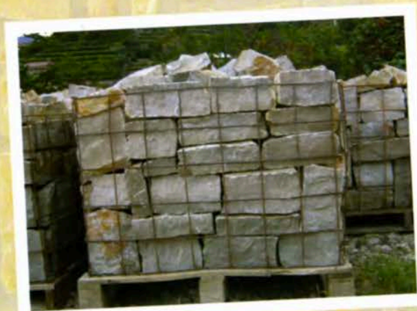
Cesta Pietrame Tranciato Scelto

L'escavazione e la lavorazione delle nostre pietre, sono certificate dalla Camera di Commercio di Bergamo come pietre originali della bergamasca della qualità e origine Pietra di Credaro.